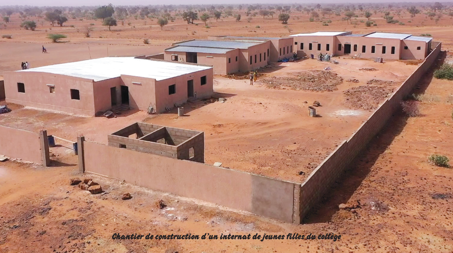
Chantier de construction d'un internat de jeunes filles du collège