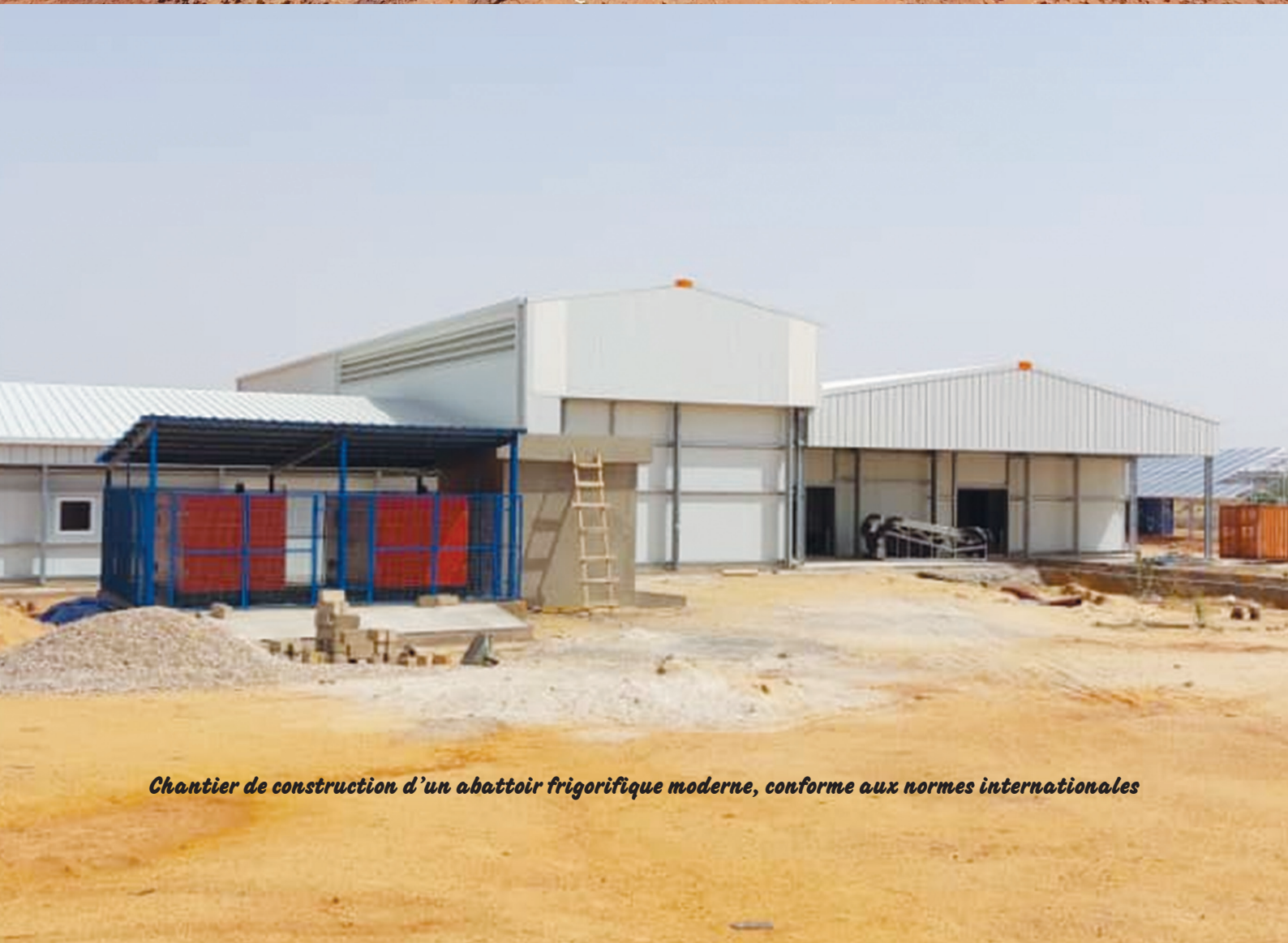
Chantier de construction d'un abattoir frigorifique moderne, conforme aux normes internationales